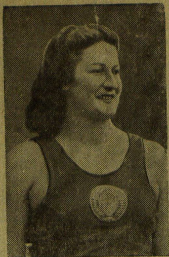
В Москве. На стадионе «Динамо» известная спортсменка, чемпион Европы и рекордсмен мира Нина Думбадзе бросила диск на 53 метра 25 сантиметров, установив этим самым новый мировой рекорд. На снимке: Нина Думбадзе.